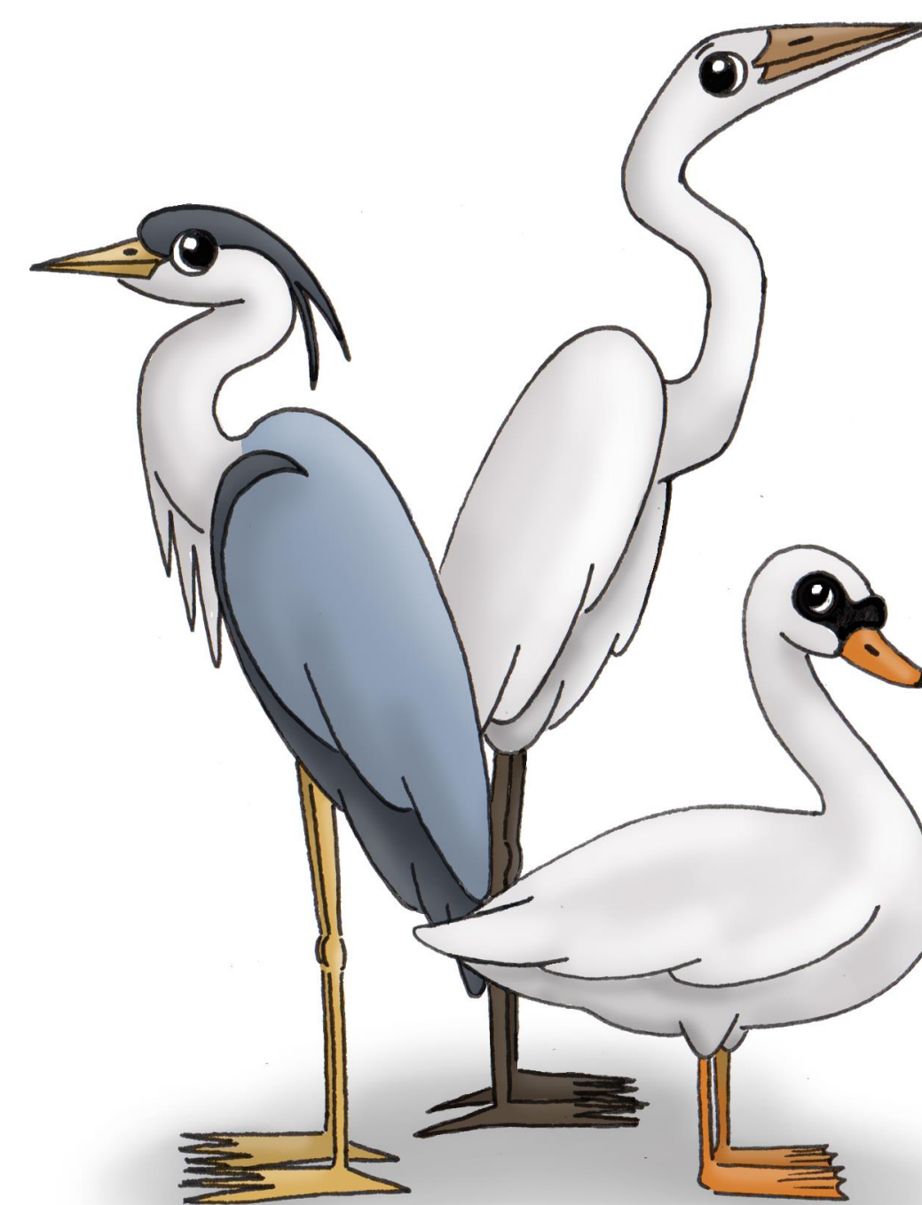
Fanny Rubizzi. (2024) « Le cygne, le héron et l'aigrette ».

- Les contes choisis - Les contes ajoutés en fonction des anecdotes recueillies sur le terrain - La contribution des partenaires (ONF) - L'apport des SHS - Jeu et implication des lecteurs