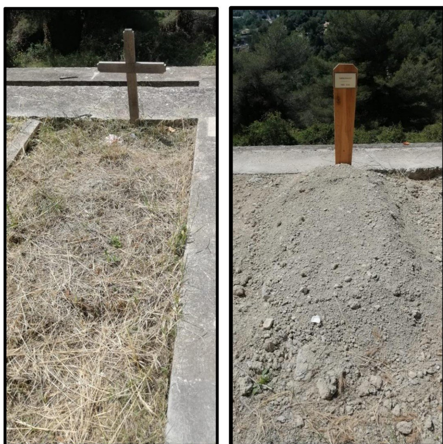
Photos des sépultures de deux personnes en migration décédées sur la commune de Menton. Les décès remontent à 2017 (gauche) et 2023 (droite).