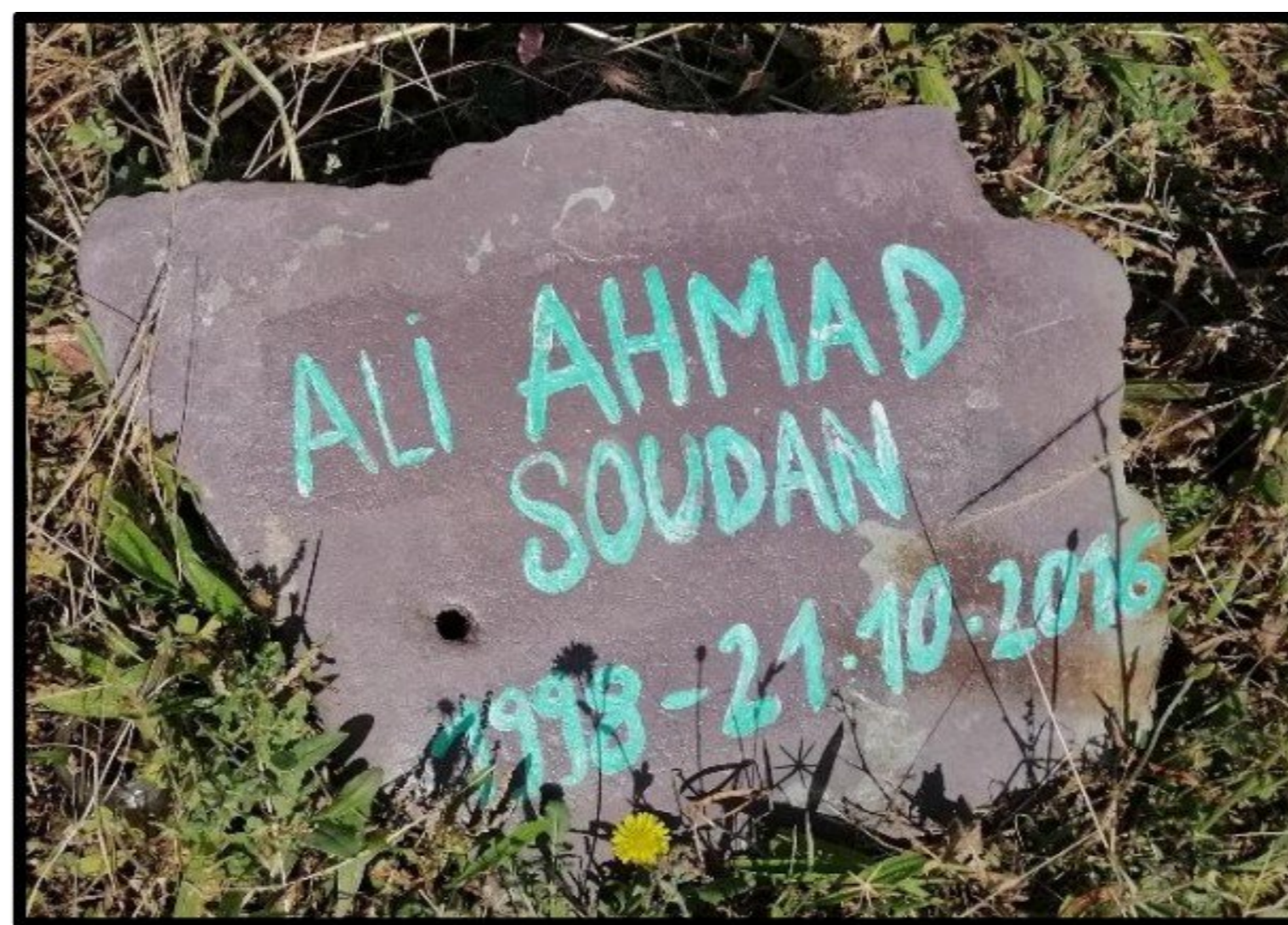
Exemple d'une stèle en hommage à Ali Ahmad, décédé en 2016. Mémorial du Pont Saint Ludovic.

Ces discours et gestes émanent d'acteurices non-institutionnel·les.