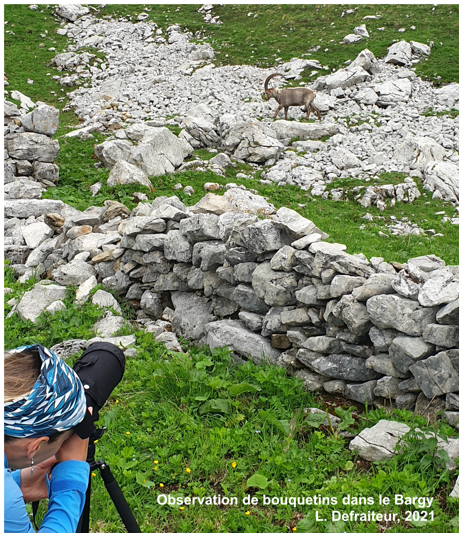
Observation de bouquetins dans le Bargy L. Defraiteur, 2021