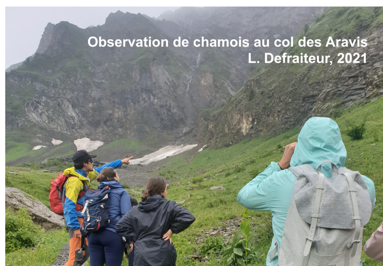
Observation de chamois au col des Aravis L. Defraiteur, 2021

Les recherches effectuées sur le tourisme faunique démontrent que la valorisation de la faune comme ressource touristique est plus large que la seule rencontre physique et visuelle. D'autre part, nos investigations mettent en avant la façon dont les processus de diversification peuvent être liés à des démarches individuelles.