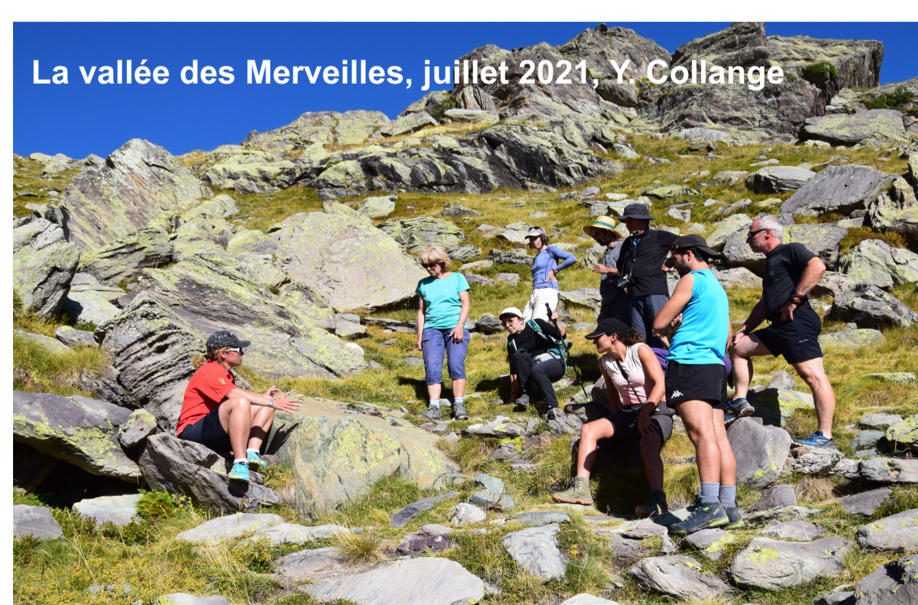
La vallée des Merveilles, juillet 2021, Y. Collange

L'approche comparée avec d'autres territoires de montagne où les gravures rupestres sont activées comme ressource touristique permet, en retour, de mieux comprendre les freins à leur mise en valeur en Haute-Maurienne. Reproductible et transférable, cette méthode est pertinente pour analyser le rôle des jeux d'acteurs, des modes de gouvernance et de la formation des professionnels du tourisme dans l'activation des ressources territoriales.