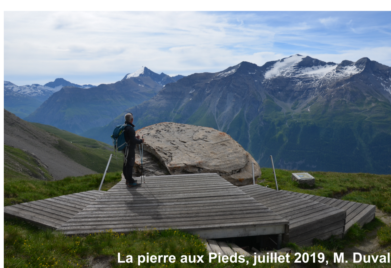
La pierre aux Pieds, juillet 2019, M. Duval

Les recherches engagées sur cet axe démontrent le peu de visibilité des gravures rupestres dans les paysages touristique et patrimonial de la vallée de la Haute-Maurienne. Peu connus et appropriés en dehors du cercle des archéologues, peu investis par les élus et les prestataires touristiques, éclipsés par d'autres types de ressources, ces sites peuvent être qualifiés de ressource latente, dont le potentiel touristique n'a pas (encore ?) été activé.